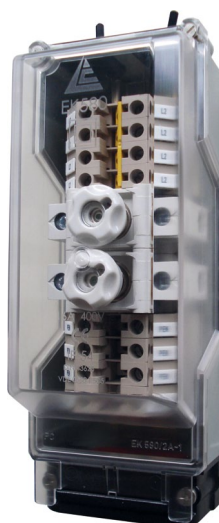
Obudowa EK 580 o długości 243 mm z przykładowym wyposażeniem