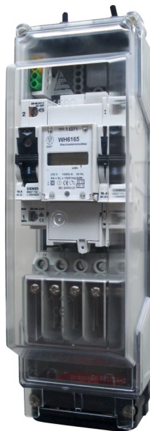
Obudowa EK 580 o długości 288 mm z przykładowym wyposażeniem