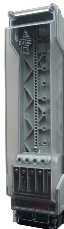
Obudowa do wielofunkcyjnego zastosowania EK 580